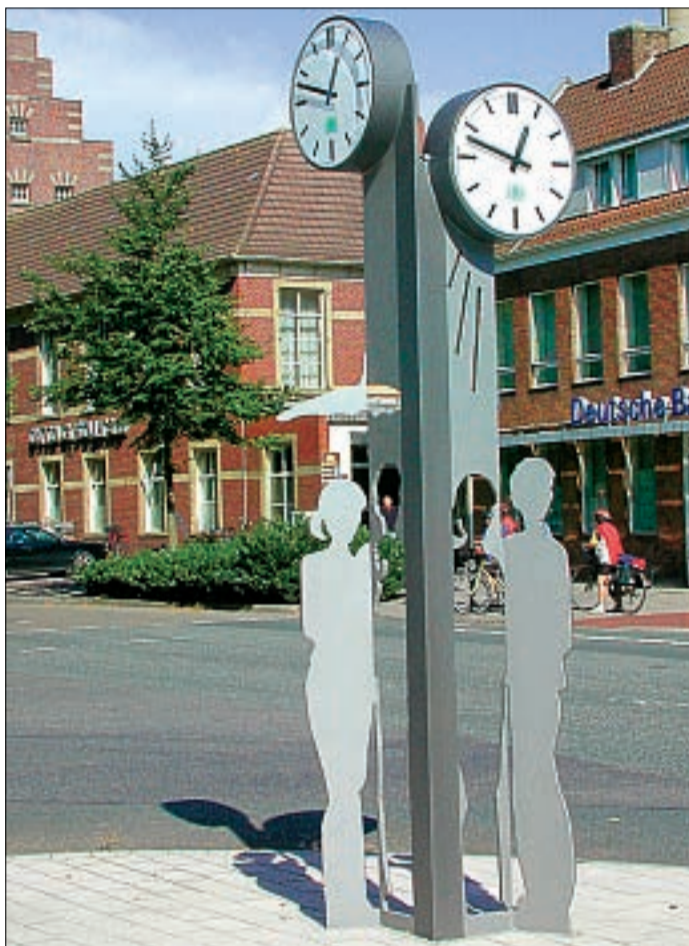
Sie steht unterm Regenschirm, er unter Sonnenstrahlen. Bei beiden ist es kurz vor eins. Die neue Marktplatzuhr macht es möglich. Seit gestern ist sie die neue Norder Attraktion.

Für die musikalische Umrahmung der kleinen Feierstunde sorgte der Männergesangsverein Norden (Seite 3).